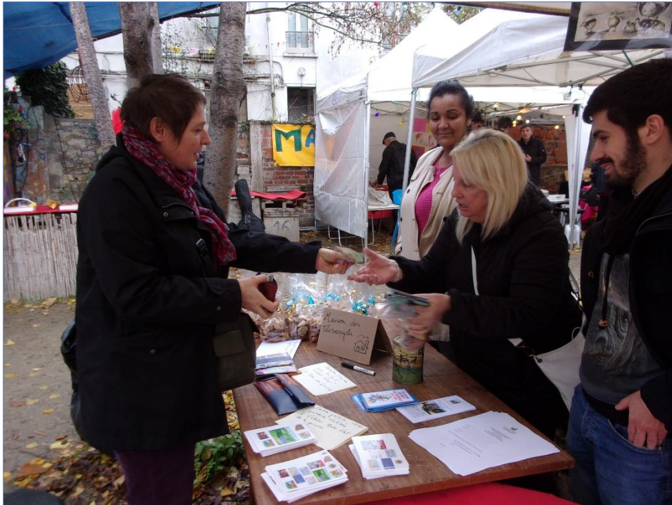
Bazaar de Noël, fête des Thermopyles, jardin des fêtes

Par ailleurs, la Maison des Thermopyles contribue à la diffusion du dispositif des pensions de famille auprès grand public comme des professionnels, en répondant régulièrement aux sollicitations de visites ou interview, souvent par la Fondation Abbé Pierre ou l'Unafa (Union professionnelle du logement accompagné). Les habitants en sont pleinement acteurs et apprécient ces moments de partage sur leur lieu de vie et son fonctionnement.