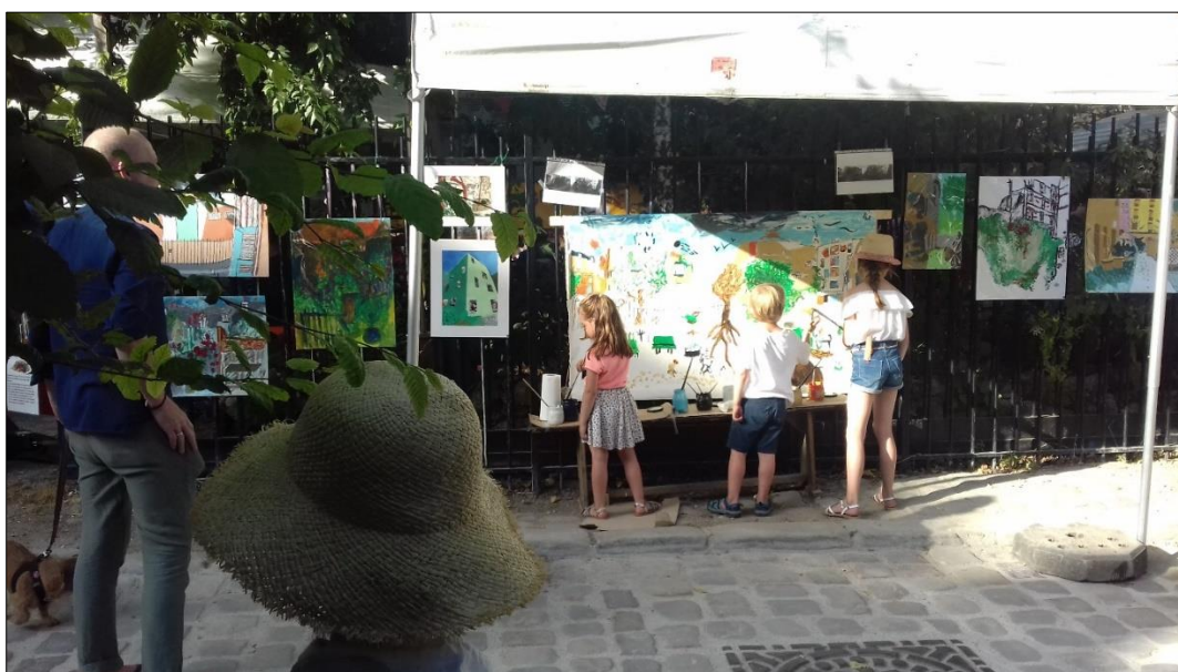
Exposition Atelier Bulle d'art et fresque participative, fête des Thermopyles, grilles du jardin des fêtes