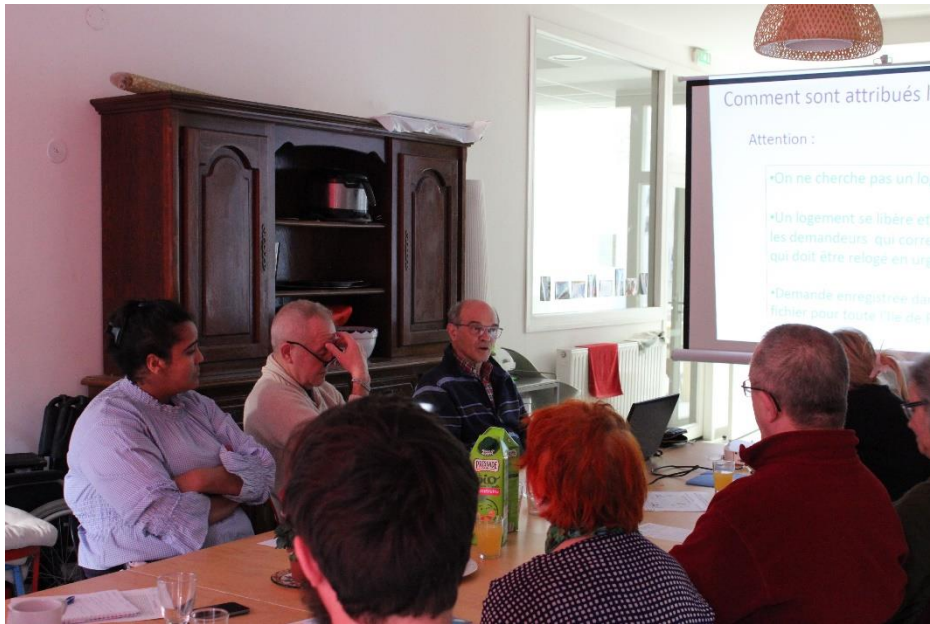
Réunion « Logement social » avec le Collectif Logement Paris 14