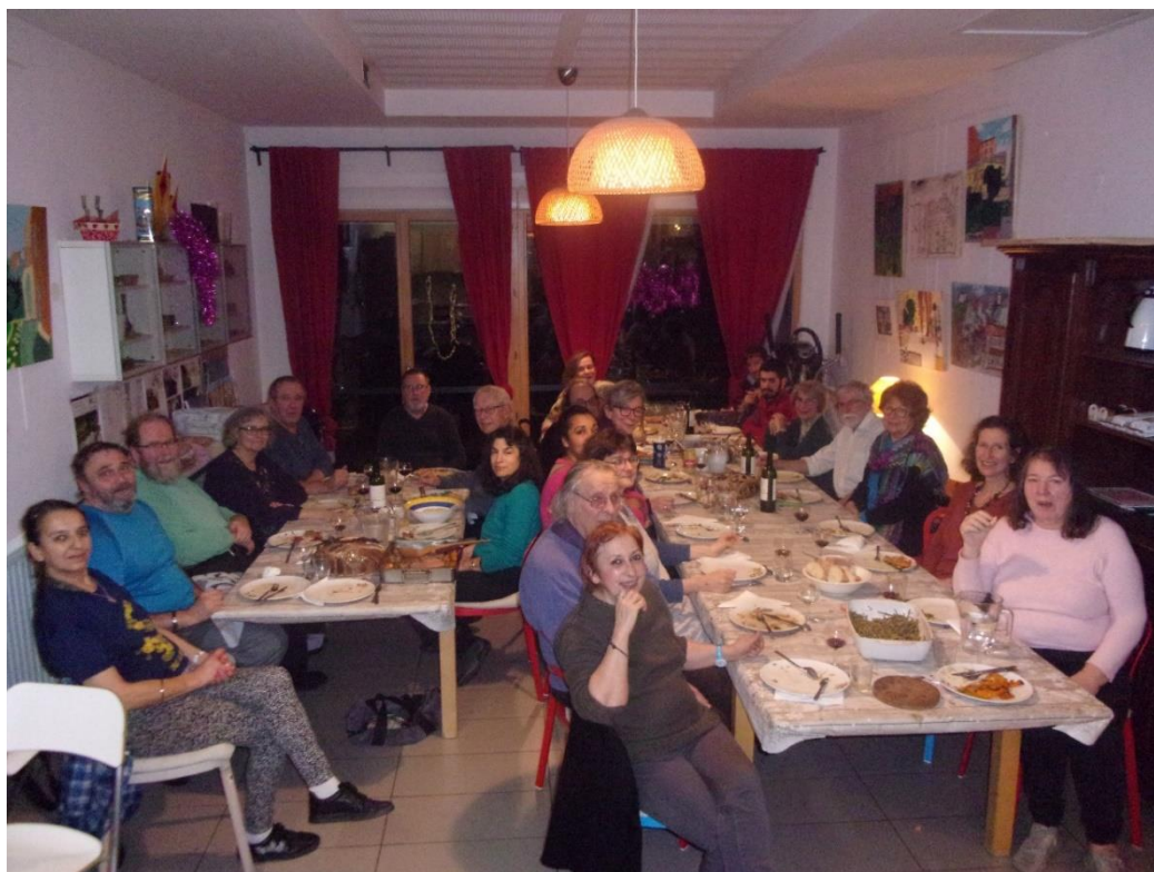
Repas de Noël

Plusieurs grands repas ont été de très beaux moments de convivialité cette année. Ils sont l'occasion d'inviter les membres du CA et amis de l'association, et d'entretenir les liens avec d'autres pensions de familles.